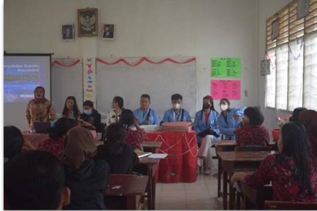
Gambar 2. Penyampaian Materi Narasumber

Para peserta sangat antusias mengikuti kegiatan ini, terbukti seluruh peserta hadir dari seluruh sesi pertemuan. Kegiatan ini dilaksanakan pada salah satu kelas yang ada di SMA ini. Mitra telah memberikan izin untuk menggunakan kelas ini agar kegiatan pelatihan ini berjalan dengan baik sehingga peserta juga mudah untuk datang ke tempat pelatihan.