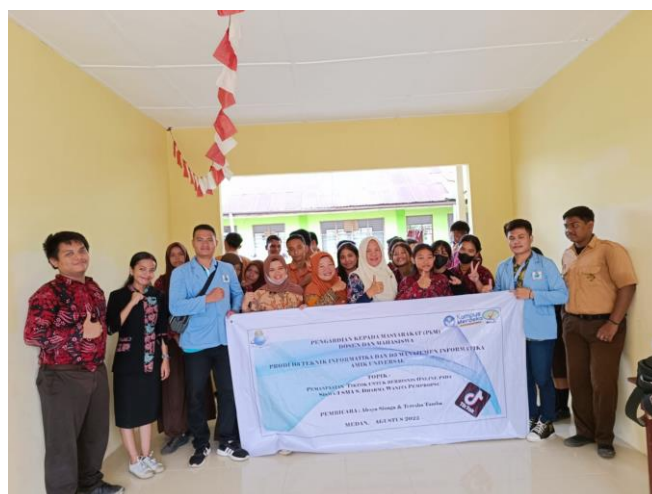
Gambar 4. Sesi Photo Bersama