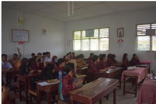
Gambar 3. Sesi Diskusi